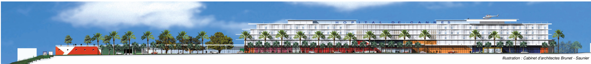
Illustration : Cabinet d'architectes Brunet - Saurier