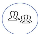
GROUPES Par sujets et centres d'intérêt