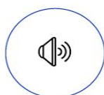
ACTUALITÉS Diffusées par l'établissement

Nos professionnels téléchargent l'application sur smartphone ou tablette et s'inscrivent gratuitement en entrant le code délivré par l'établissement. Avec une ergonomie comparable aux réseaux sociaux, allis est facilement pris en main par nos agents.